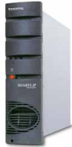
SHARYS 030 A

Wszystkie prostowniki serii SHARYS IP (SH-IP) posiadają certyfikat TÜV SÜD na zgodność z wymogami dotyczącymi bezpieczeństwa produktu (EN 61204-7 i EN 60950-1)