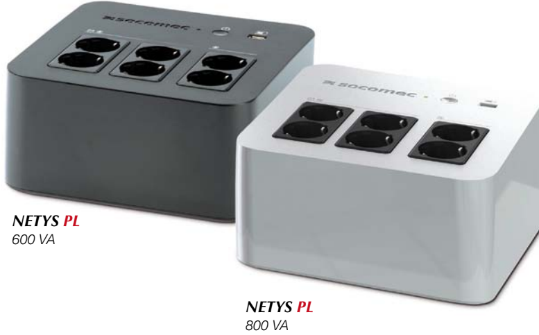
NETYS PL 600 VA

Kullanıcıyla dost çok-socketli koruma 600 ve 800 VA